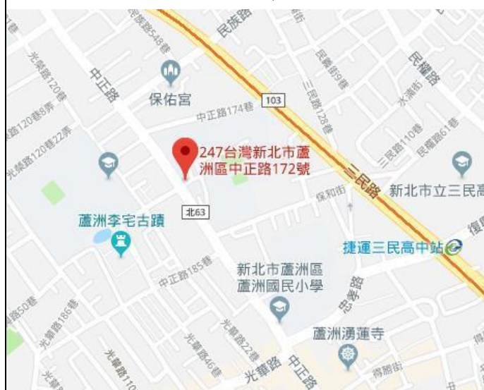
國立空中大學位置圖